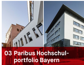
03 Paribus Hochschul- portfolio Bayern