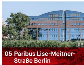
05 Paribus Lise-Meitner- Straße Berlin