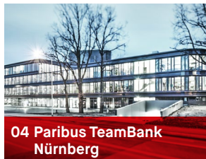
04 Paribus TeamBank Nürnberg