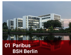
01 Paribus BSH Berlin