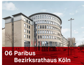
06 Paribus Bezirksrathaus Köln