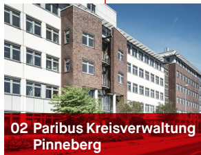
02 Paribus Kreisverwaltung Pinneberg