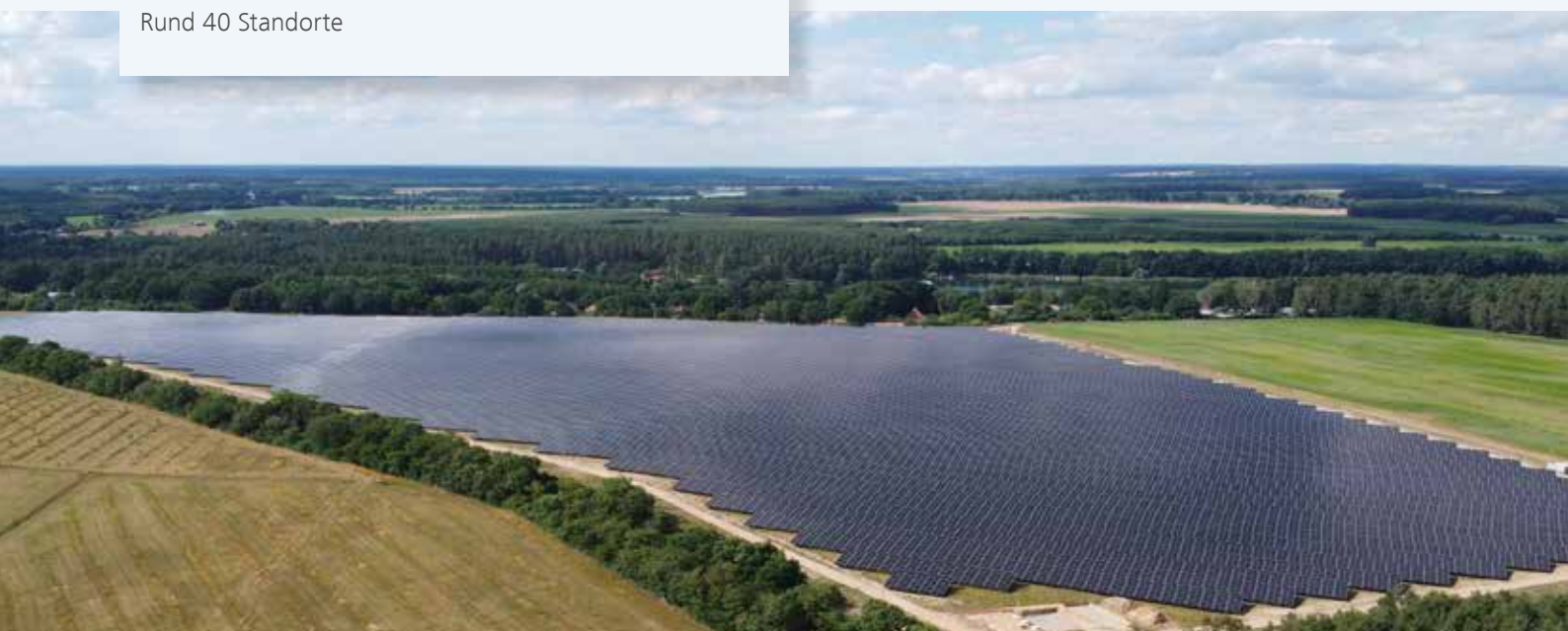
Solarpark Siena, Strasen, Mecklenburg-Vorpommern