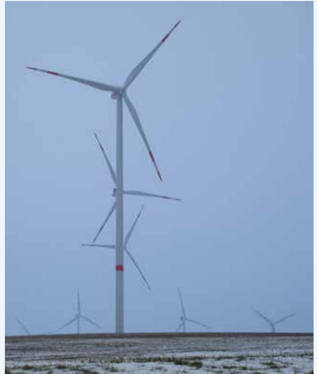
Windpark Kirchengel III, Thüringen